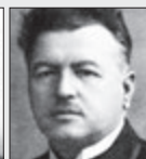
Jaroslav Galia SKLADATEL