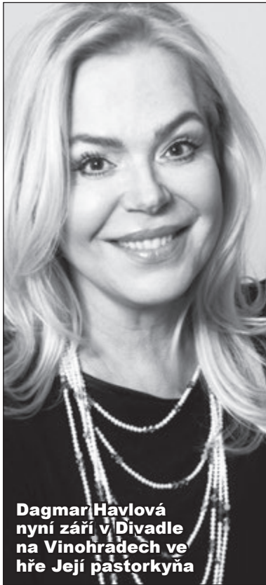
Dagmar Havlová nyní září v Divadle na Vinohradech ve hře Její pastorkyňa