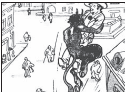
Čert: „Volal jsi mě, proto ti pomohu, ale upíšeš se mi svou duší!“