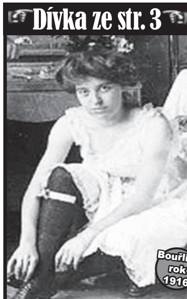
Dívka ze str. 3