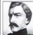
Havlíček Borovský NOVINÁŘ