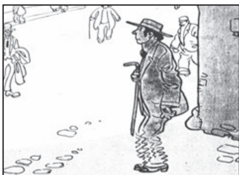
Hříšník: „A jsem v tom až po uši. Dlužím, kam se podívám. Čert aby to vzal!“

Novoměstské noviny k počtě Humoristickým listům (1916)