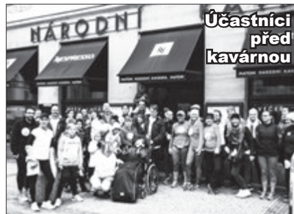
Účastníci před kavárnou