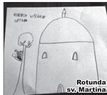
Rotunda sv. Martina