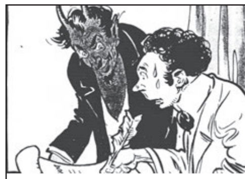
Hříšník: „Podepíšu, ale vykonáš tři úlohy, které ti poručím.“ Čert: „Plati!“