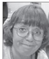
Barbora Hrzánová, herečka