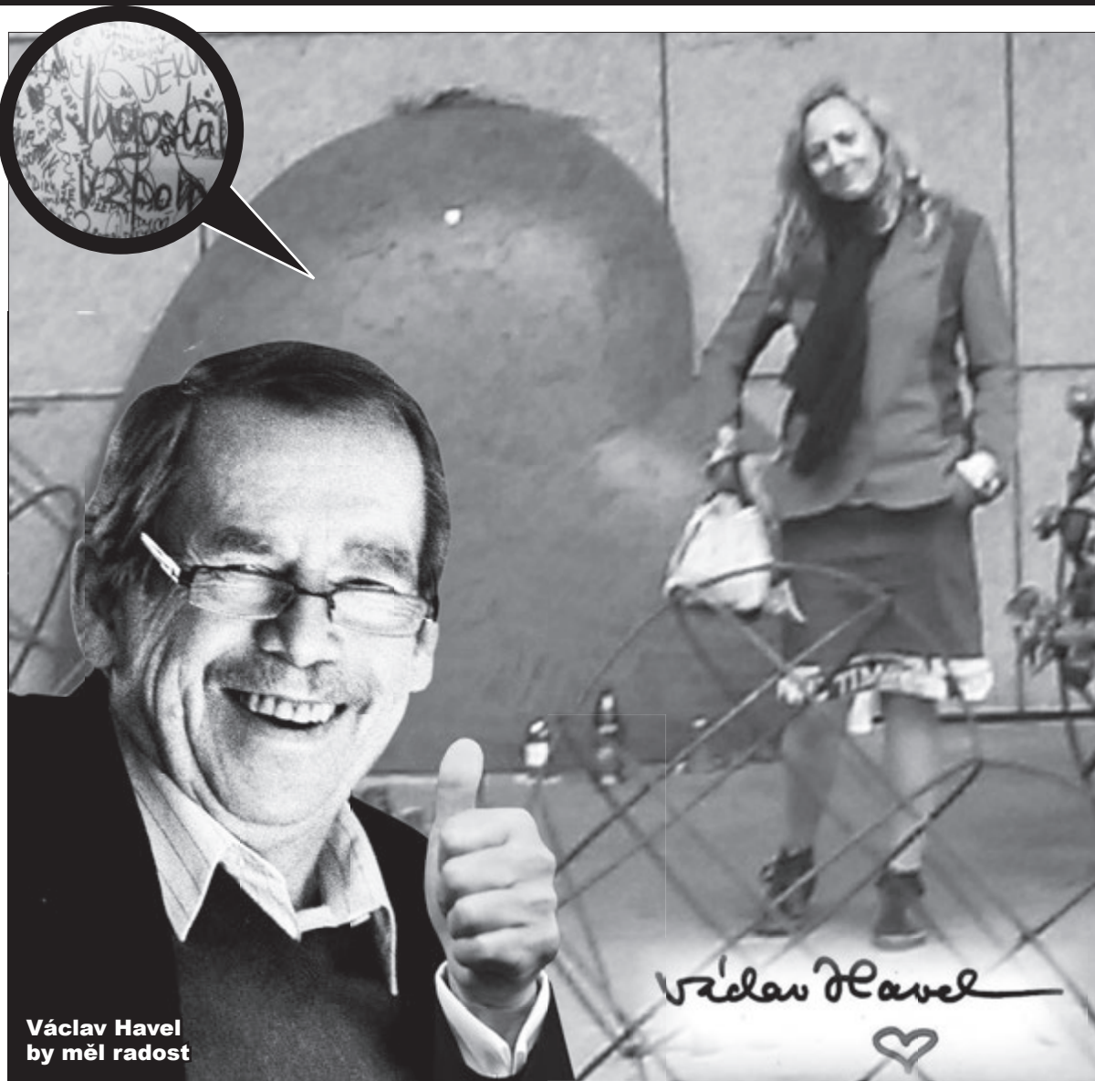
Václav Havel by měl radost