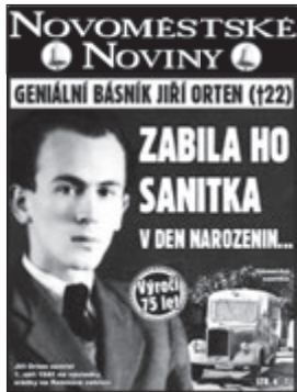
Novoměstské noviny ZÁŘÍ 2016

Skvělý článek o mém oblíbeném básníkově Jiřím Ortenovi. Dobře, že o něm píšete, je neprávem opomíjený!