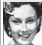
Lída Baarová HEREČKA