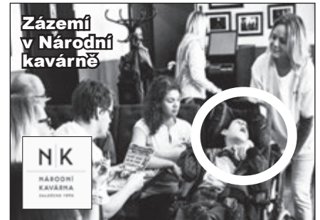
Zázemí v Národní kavárně