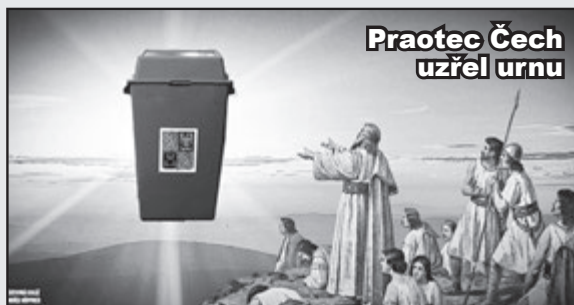
Zertová koláž. Ondřej Hoppner

Když zvolíme „správně“, zjistíme, že se nám součtem slibovaných úlev sníží daně o 132 procent. Důchody se naopak zvednou o tolik, že důchodci budou lítat