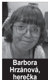
Barbora Hrzánová, herečka