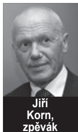
Jiří Korn, zpěvák