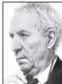
JAN GROSSMAN Režisér, dramaturg, umě- lecký šéf. Po roce 1968 dostal výpověď.