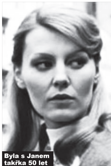
Byla s Janem takřka 50 let

Karla Chadimová Herečka, manželka Jana Třísky