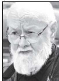
IVAN VYSKOČIL Zakladatel Diva- dla Na zábradlí, herec, režisér, básník