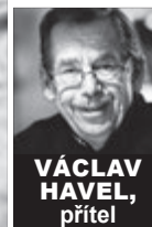
VÁCLAV HAVEL, přítel

Od roku 1968 byla manželkou herce Jana Třísky, který zahynul po pádu z Karlova mostu letos 25. září.