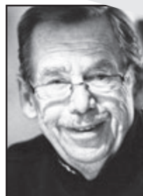
VÁCLAV HAVEL Scénárista (Zahradní slavnost), později prezident ČR