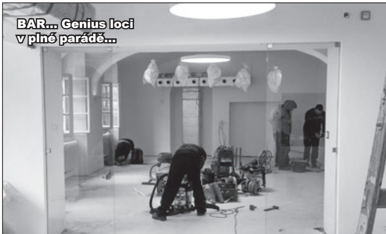
BAR... Genius loci v plné parádě...