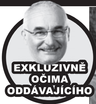
EXKLUZIVNĚ OČIMA ODDÁVAJÍCÍHO