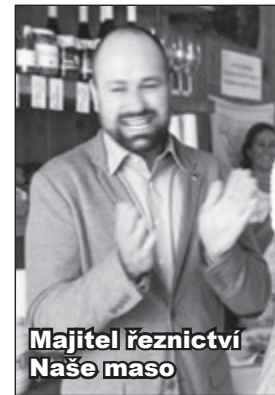
Majitel řeznictví Naše maso