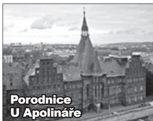
Porodnice U Apolináře