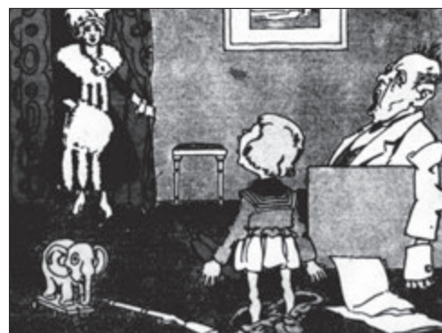
Vidiš, synu, to je modistka!