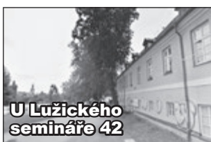
U Lužického semináře 42

Všemu dominuje celkový nepořádek. Místo slouží