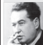
Egon Erwin Kisch NOVINÁŘ