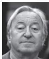
Jiří Lábus , herec