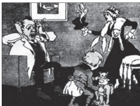
Snad jen klobouk z kalhot pro kluka!