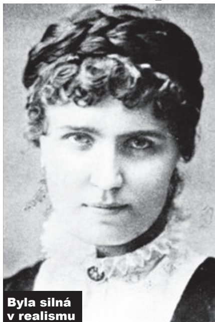
Byla silná v realismu