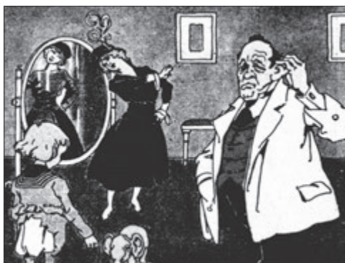
Nic platno, muži, s tím ani nemohu ven!