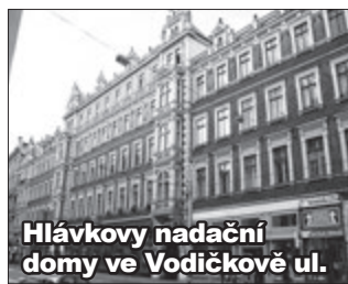
Hlávkovy nadační domy ve Vodické ul.