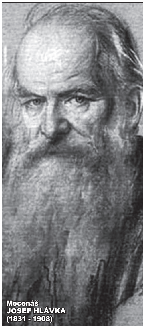
Mecenáš JOSEF HLÁVKA (1831 - 1908)