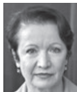
Hana Maciuchová , herečka