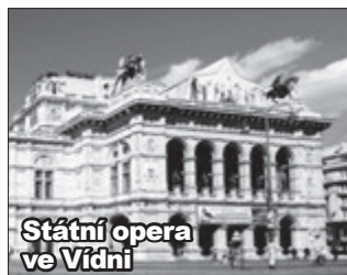
Státní opera ve Vídni