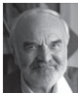
Zdeněk Svěrák , herec, textař