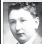
Jaroslav Hašek SPISOVATEL