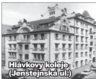
Hlávkovy koleje (Jenštejnská ul.)