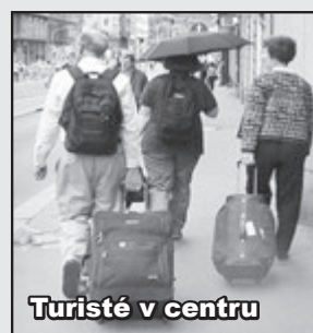
Turisté v centru

Hluk v nočních hodinách, sdílené bydlení, nepořádek na ulicích a tak dále. Alespoň na