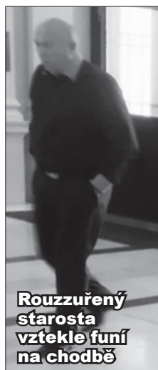
Rouzzuřený starosta vztekle funí na chodbě