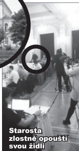
Starosta zlostně opouští svou židli