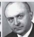
Otakar Vávra REŽISÉR

• Václav K. Klicpera *23. 11. 1792 Chlumec nad Cidlinou †15. 9. 1859 Praha Dramatik, Stavovské divadlo.