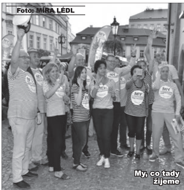
My, co tady žijeme