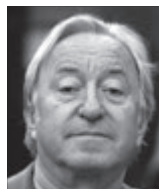
Jiří Lábus, herec