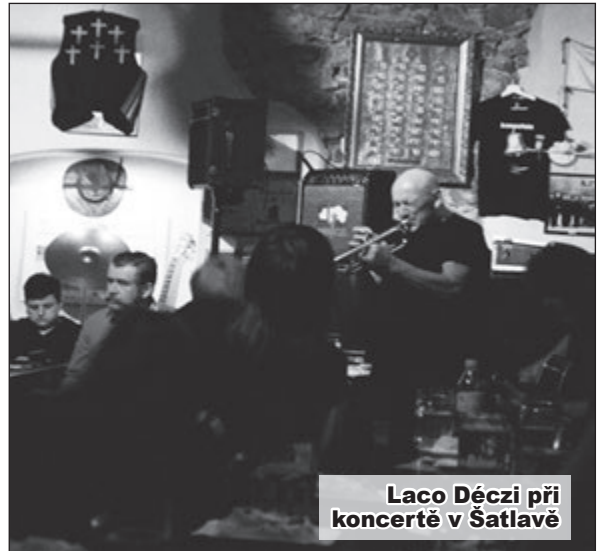
Laco Déczi při koncertě v Šatlavě