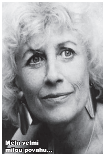
Měla velmi milou povahu...