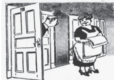
Host v hotelu: „Ještě bych prosil jednu svíčku.“ Pokojská: „Hned prosím.“