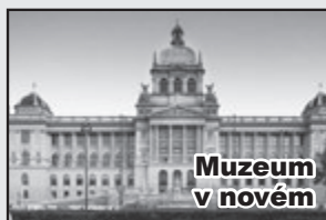
Muzeum v novém

Tak se nám po letech vylouplo Národní muzeum, a nutno říci, že do nevšední krásy. Rekonstrukce to byla skutečně zevrubná, jak na interiérech, tak na vnějším vzhledu této impozantní budovy. Jak by také ne, když nad pracemi restaurátorů a řemeslníků všeho druhu bděl po generace nejznámější symbol muzea - kostra plejtváka myšoka, jak se