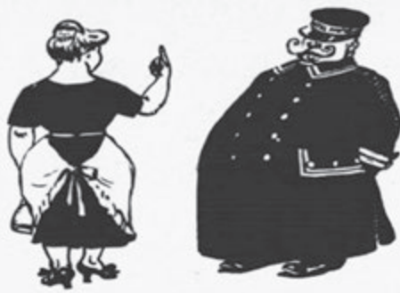
Pokojská k portýrovi: „Pošlete pro svíčku.“