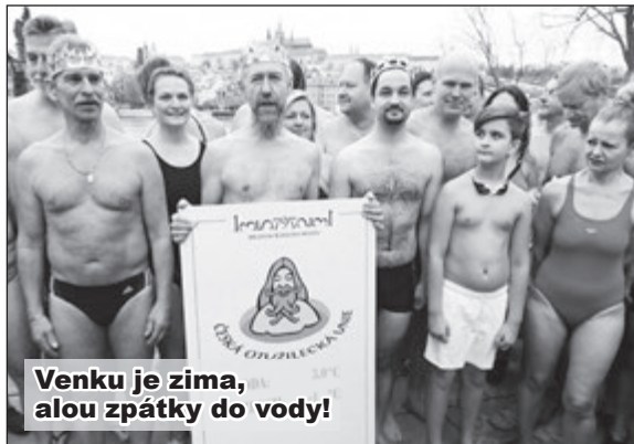
Venku je zima, alou zpátky do vody!

Vltava - Voda tři stupně Celsia, vzduch mínus jedna. Tak to právě není otužilcův sen. Pět desítek otužilců se ohrálo ve Vltavě při každoročním tříkrálovém plavání. Účastníci se vrhli u loděk do Vltavy u Karlova mostu pod sochou Jana Nepomuckého (také byl kdysi