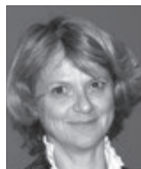
Taťjana Medvecká, herečka