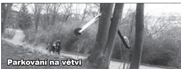
Parkování na větví

Hlavu pomazanou, bývalého radního Dolínka, vůbec nenapadlo řešit, jaký bude mít tato zábava dopad na dopravu a chodce, případně co se bude