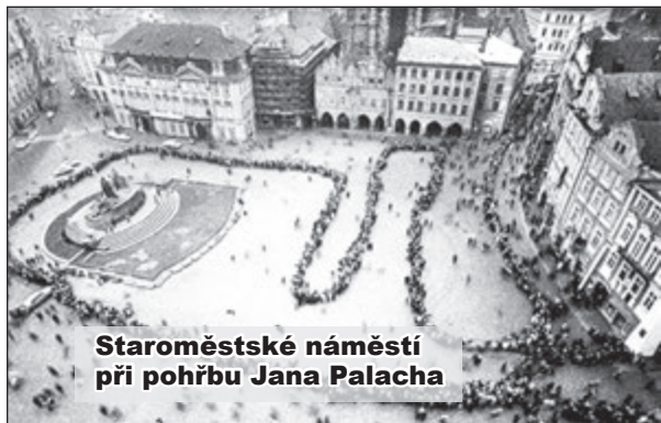
Staroměstské náměstí při pohřbu Jana Palacha