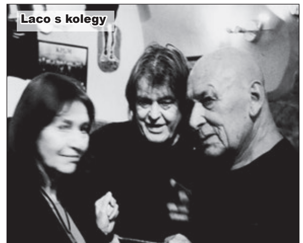
Laco s kolegy