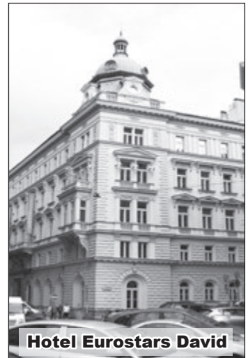
Hotel Eurostars David