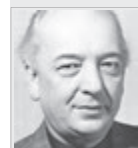
Josef Skupa LOUTKOHEREC