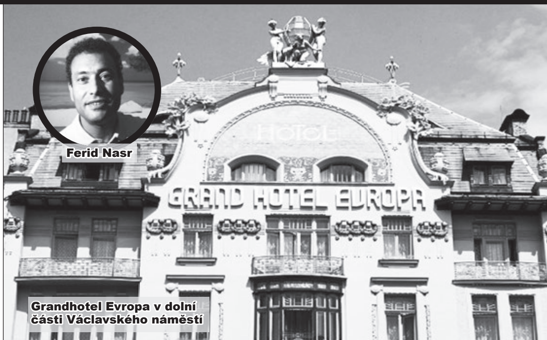
Grandhotel Evropa v dolní části Václavského náměstí