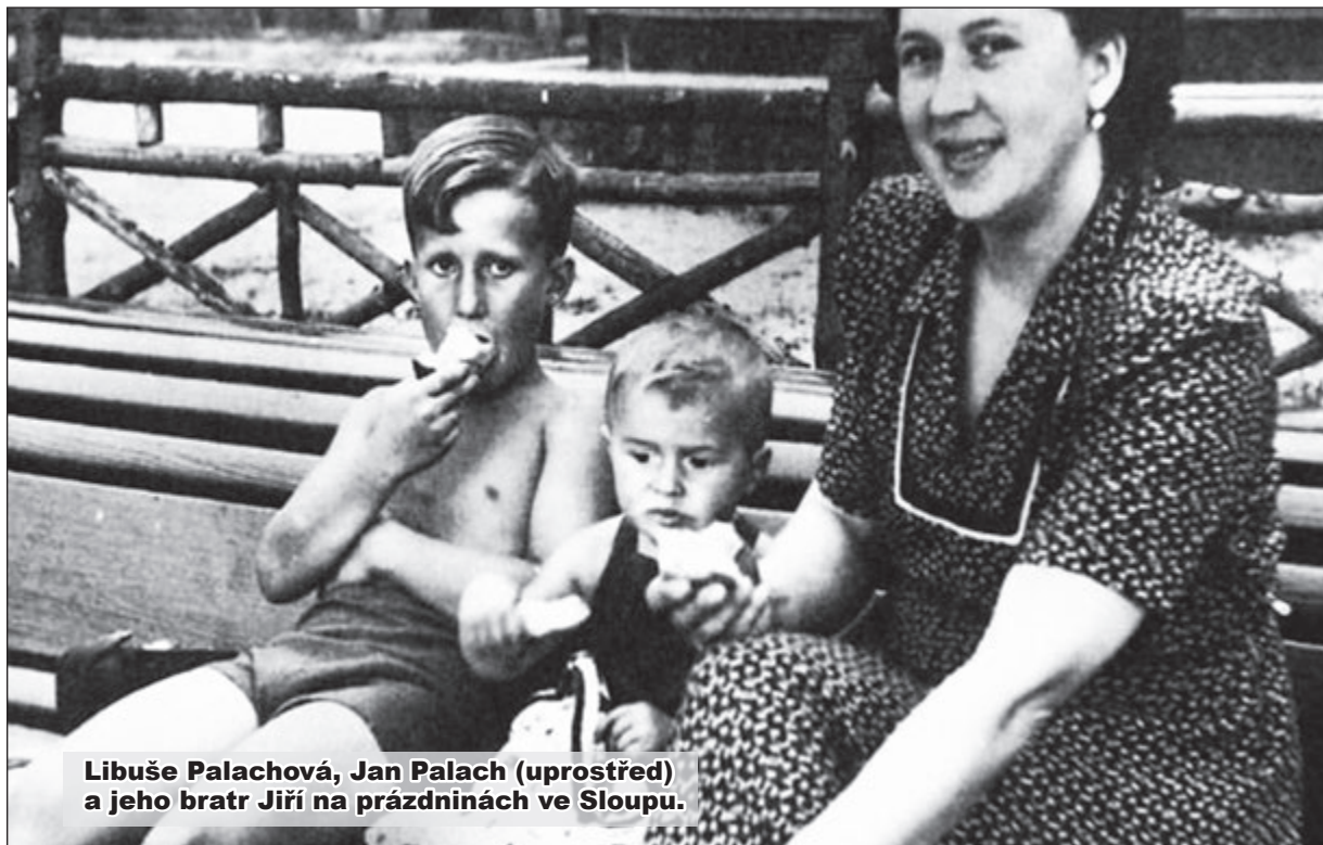
Libuše Palachová, Jan Palach (uprostřed) a jeho bratr Jiří na prázdninách ve Sloupu.