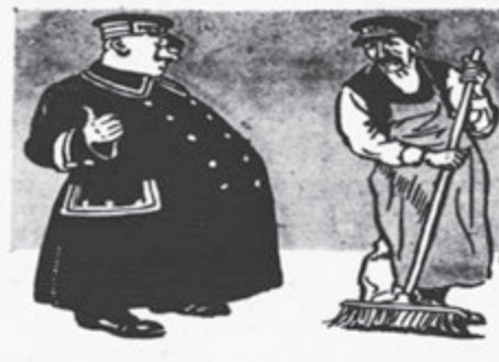
Portýr k k podomkovi: „Přineste od hokyně jednu svíčku.“