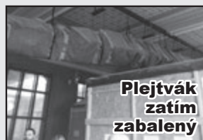
Plejtvák zatím zabalený

ve skutečnosti jmenuje známá kostra velryby. Stalo se to tím, že nastala obava, zda je kostra v takové kondici, aby byla schopna bez úhony přežít rozebrání, někde uskladnění a opět následné sestavení. Je ovšem možné, že se zaměstnanci muzea báli, aby nedopadli stejně, jako