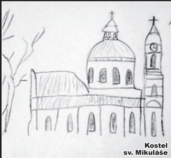
Kostel sv. Mikuláše

Odměna: DVD Indiánská pohádka Divadélka Romaneto. Kde: Náprstkovo muzeum (pokladna).