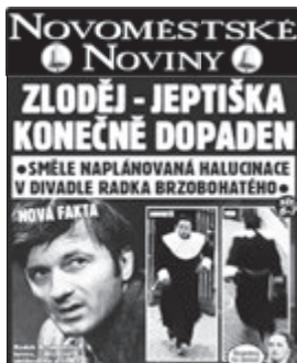
Novoměstské noviny, LEDEN 2015

Vážená redakce, Velice mě pobavil příběh zloděje, který kradl v převleku za jeptišku.