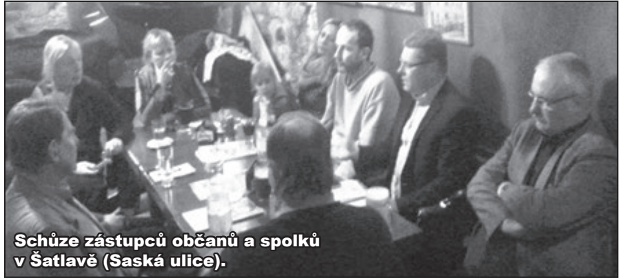
Schůze zástupců občanů a spolků v Šatlavě (Saská ulice).

Obrovskou nevoli pak vzbuzují kroky vedení radnice proti nejoblíbenějším místním novinám: Staroměstským, Malostranským a Novoměstským. Starosta Lomecký, jehož TOP 09 utrpěla ve volbách nejchabnější možné vítězství (o jeden