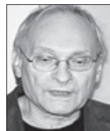
Ladislav Smoček, režisér