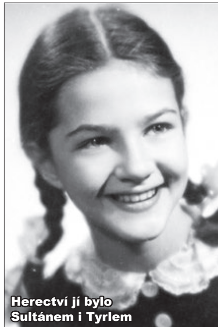
Herecvi jí bylo Sultánem i Tyrlem