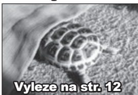
Vyleze na str. 12