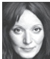
Szidi Tobias, zpěvačka