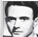
František Čáp, režisér