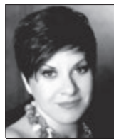
Dagmar Pecková, pěvkyně