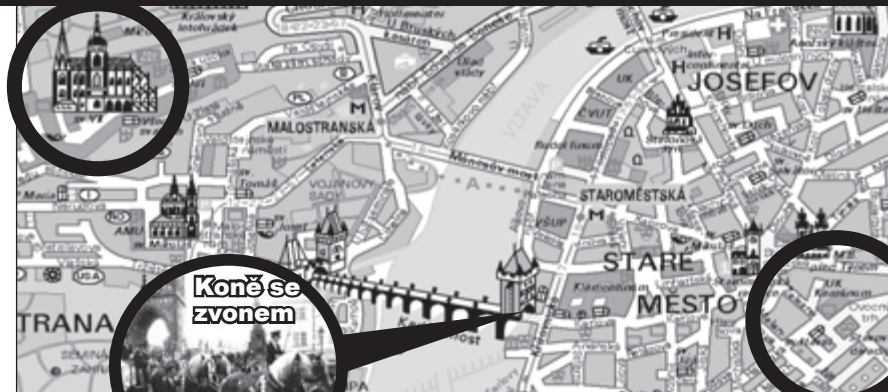
Koně se zvonem