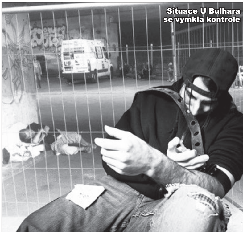
Situace U Bulhara se vymkla kontrole

Novoměstské noviny budou situaci sledovat a pokusí se pomoci. Pište na adresu: redakce@novomestskenoviny.eu