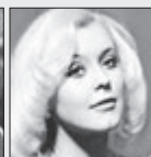
Valérie Čizmarová ZPĚVAČKA