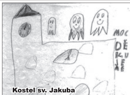
Kostel sv. Jakuba