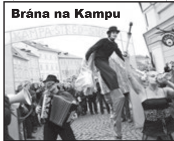
Brána na Kampu

Na Malé Straně se ustavily další spolky a jejich programy a setkání v klubech i na náměstích vylepšují občanský život v jinak