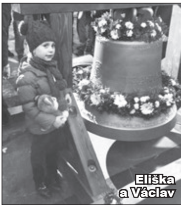
Eliška a Václav

Nový zvon Václav zní u sv. Havla na památku prezidenta. Nad Prahou se v neděli 5. 3. v osm hodin večer poprvé rozezněl zvon Václav z kostela sv. Havla na Starém Městě. Ve slavnostním průvodu mu na cestu z chrámu sv. Víta, kde mu požehnal arcibiskup Dominik Duka, zvonily svými zvonečky stovky lidí. Podobný počín se podařil v roce 2009 u stejnojmenného zvonu na Malostranské besedě díky tehdejšímu starostovi Petru Hejmovi.