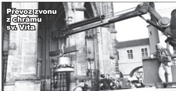
Převoz zvonu z chrámu sv. Víta