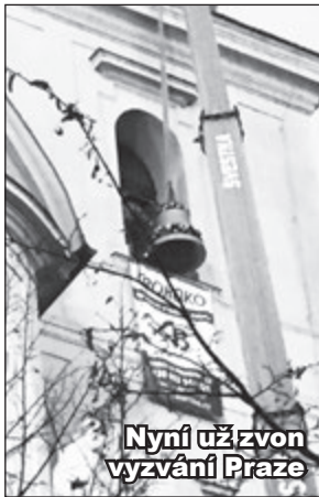
Nyní už zvon vyzvání Praze

Nový zvon Václav zní u sv. Havla na památku prezidenta. Nad Prahou se v neděli 5. 3. v osm hodin večer poprvé rozezněl zvon Václav z kostela sv. Havla na Starém Městě. Ve slavnostním průvodu mu na cestu z chrámu sv. Víta, kde mu požehnal arcibiskup Dominik Duka, zvonily svými zvonečky stovky lidí. Podobný počín se podařil v roce 2009 u stejnojmenného zvonu na Malostranské besedě díky tehdejšímu starostovi Petru Hejmovi.