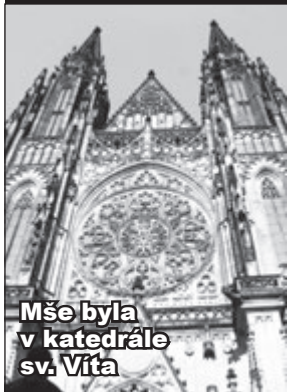
Mše byla v katedrále sv. Víta