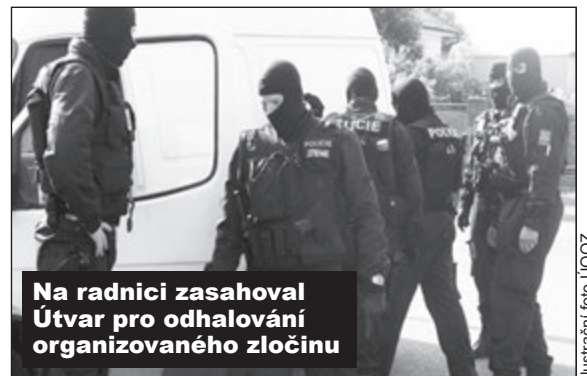
Na radnici zasahoval Útvar pro odhalování organizovaného zločinu