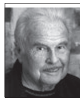
Luděk Munzar, herec