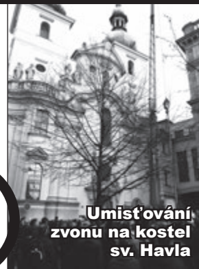
Umístování zvonu na kostel sv. Havla