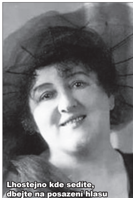
Lhostejno kde sedíte, dbejte na posazení hlasu