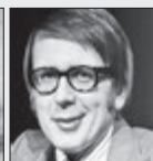
Miloslav Šimek HUMORISTA