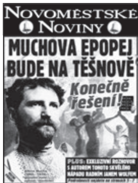
Novoměstské noviny ÚNOR 2017