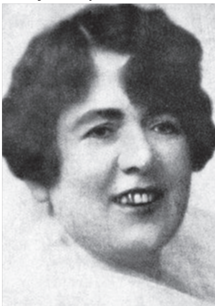
HANA PODOLSKÁ (1880 - 1972)