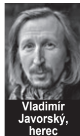
Vladimír Javorský, herec