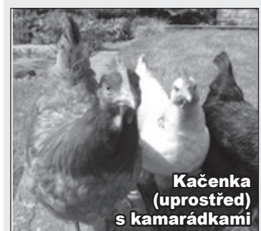
Kačenka (uprostřed) s kamarádkami