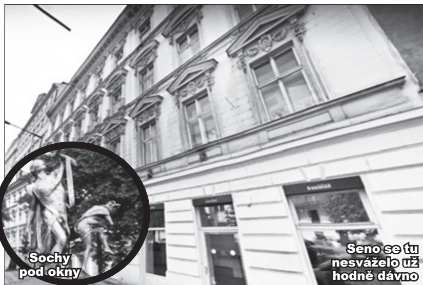
Sochy pod okny