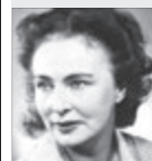
Vlasta Fabianová HEREČKA