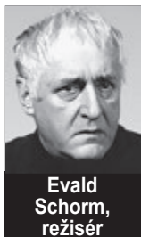
Evald Schorm, režisér

Cestovně pružinové Divadélko Romaneto - Jaroslava Nárožná a Roman Korda - odehrálo v rámci Dětského dne vystoupení pro děti Prahy 1 na Kampě a Staroměstském náměstí. Bylo to super!