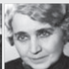
Leopolda Dostálová HEREČKA